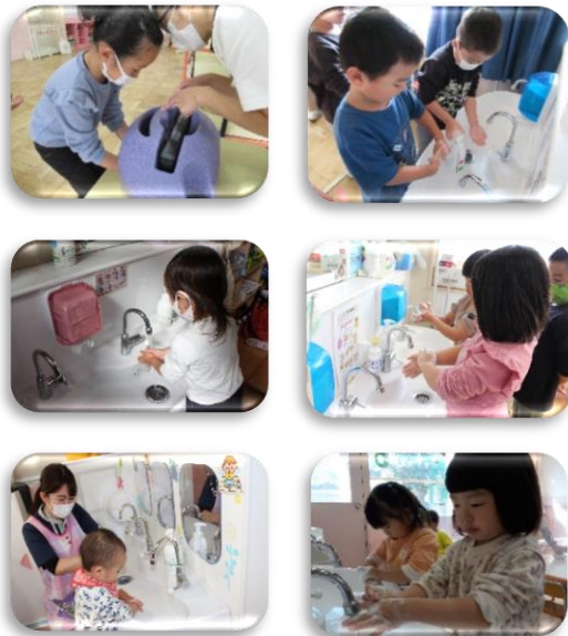
＜発達別到着目標＞ 光明看護師会作成