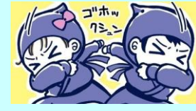
イラスト：青鹿ユウ

咳をする時、口元を手のひらで覆っていませんか？実はこれは、多くの人がしている誤った咳エチケット。咳の飛沫で出た菌やウイルスを手で受け止めると、そこから感染を広げてしまいます。園では、咳をする時は、右図のように、「忍者に変身！」スタイルなど、咳を腕で防ぐことを子ども達に勧めています。